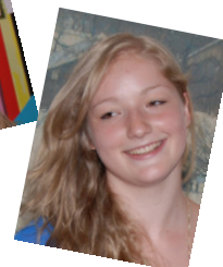
Teilnehmer aus Düns