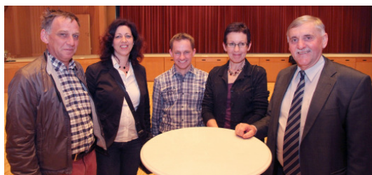
Angestellte und Mandatare aus Düns